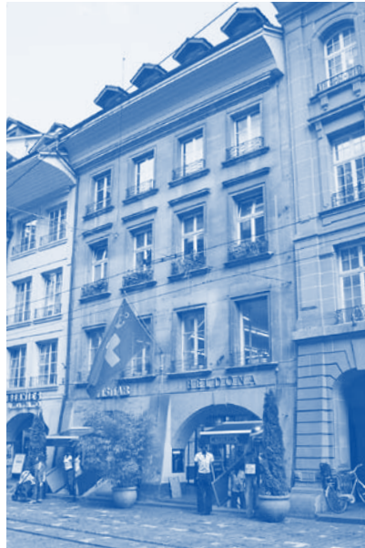
Marktgasse 9, 1912–1932

Das im Mai 1909 bezogene Logenlokal, Junkerngasse 57, im Hause von Familie Hirter, erwies sich bald als zu klein. Am 9. Februar 1912 konnte nach ausführlichen Vorbereitungen ein eigenes Zweiglokal im Wild'schen Haus an der Marktgasse 9, früher Zunft zu Webern, bezogen werden.