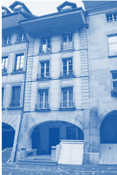
Junkerngasse 57, 1907–1912