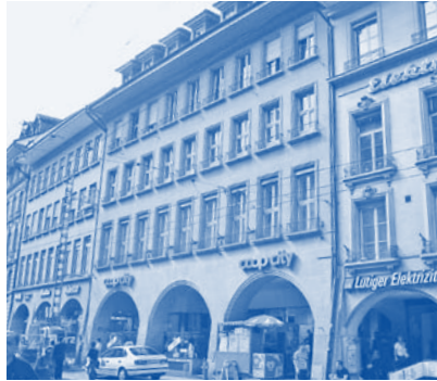
Marktgasse 24, 1932–1956