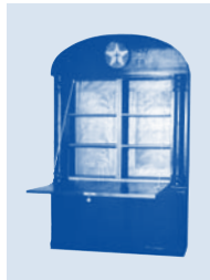
Einrichtungsgegenstände aus der Marktgasse 9 von 1912–1932