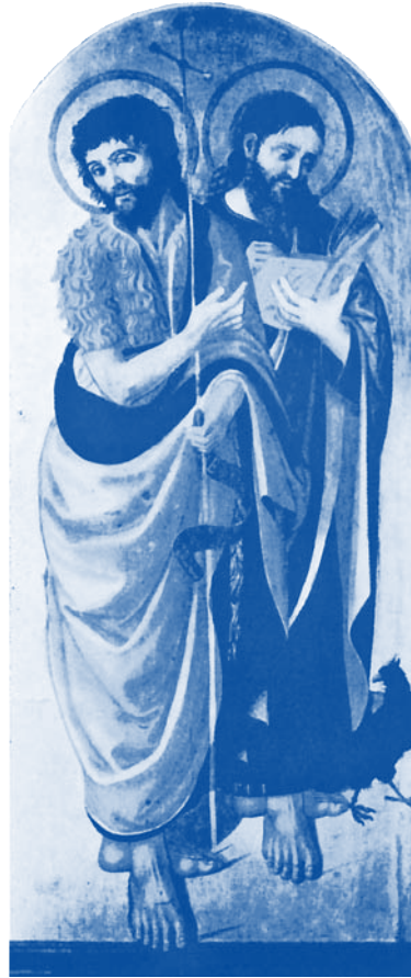
Macchiavelli, Johannes der Täufer und Johannes der Evangelist (National Gallery, London)